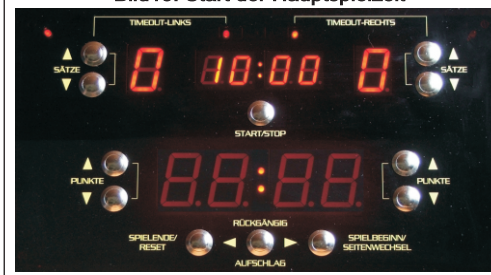
Bild13: Start der Hauptspielzeit