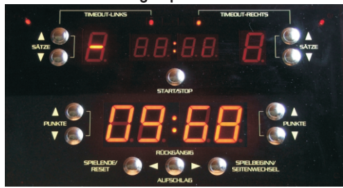
Bild11: Anzeige Spielernummer links