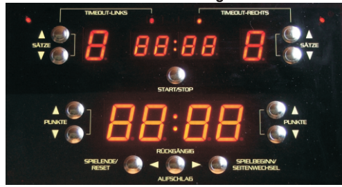
Bild3: Selbsttest - Alle Digits aktiviert