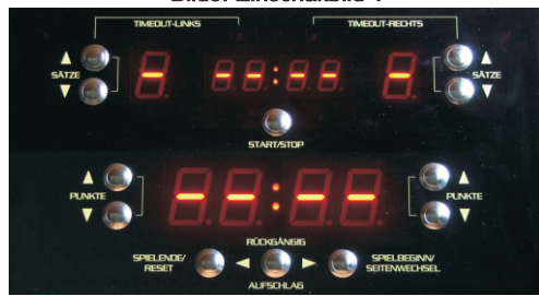
Bild5: Einschaltbild 1